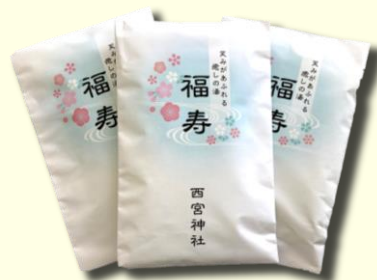
入浴剤セット【福寿】

「月参り」のご祈祷を受けられた方には、特別なお札・お守・入浴剤セットなどをお授け致します。