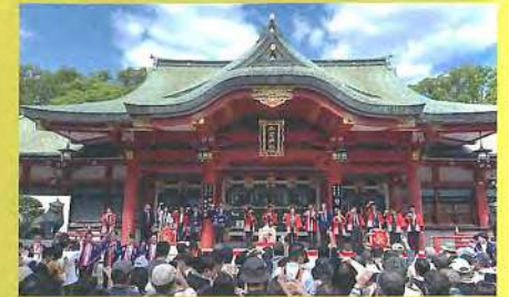
西宮酒ぐらルネサンス