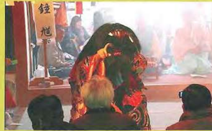
大元神楽 蛭子・鐘馗

市制百周年の慶事を皆様とお祝い致したく、諸行事を行いますので是非ご参拝・ご参加下さい。