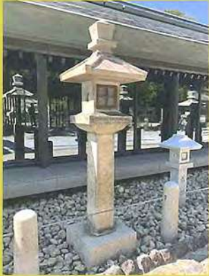
西宮神社の石燈籠

燈籠はもともと仏像に清浄な灯りを献じるために寺院に建てられ、日本へは仏教の伝来とともに渡来し、寺院建立が盛んになった奈良時代から多く作られるようになり、平安時代に献灯として神社でも用いら