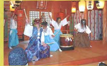
輪島市住吉神社 御神事太鼓