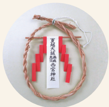
疫病の難から守られる「茅の輪守」

大祓式にて人形のお祓い・茅の輪くぐりを受けられると、さまざまな病魔・厄災を除くだけでなく、清浄を好まれる神様のご加護もより大きなものになるといわれています。