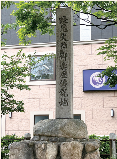
現在の御旅所 (御齋屋跡地)