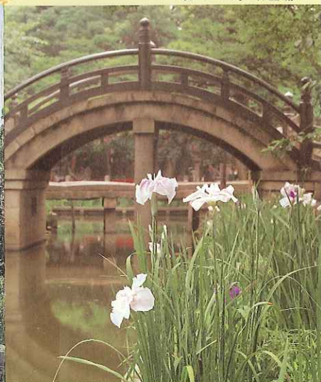
〈境内の四季・花菖蒲〉