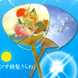
「夏えびす特製うらわ」