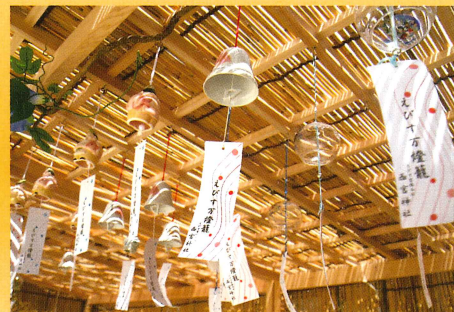
風鈴市は7、8、9、10、20日に開催。 西宮神社特製「えびす風鈴」もご用意しています。

10日 16時～ 大阪プロレスのパフォーマンスショー “勝っちゃん食堂 PRESENTS” 2012年サッポロビール イメージガールによる ゲーム大会 殺陣 (日本殺陣道協会)