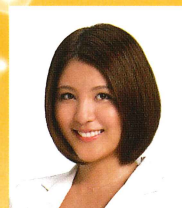
源崎トモエ 2012年サッポロビールイメージガール