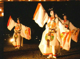
女人舞楽 奉奏 第1部 19:30～ 第2部 20:30～

西宮神社の夏の風物詩、えびす万燈籠は境内に5,000灯のろうそくが灯され、夏の夜のえびすの森を神秘的に彩ります。 松林では原笙会による女人舞楽を奉奏。(19:30/20:30の2回)